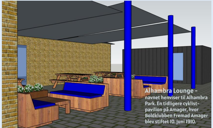
Alhambra Lounge - navnet henviser til Alhambra Park. En tidligere cyklistpavilion på Amager, hvor Boldklubben Fremad Amager blev stiftet 10. juni 1910.

Til sommer starter man med Hal 1 og 2 samt omklædningsrum, og heldigvis skifter man også vandrør så der kan komme vand i bruserne, de gamle rør er jo også helt tilbage fra 30erne